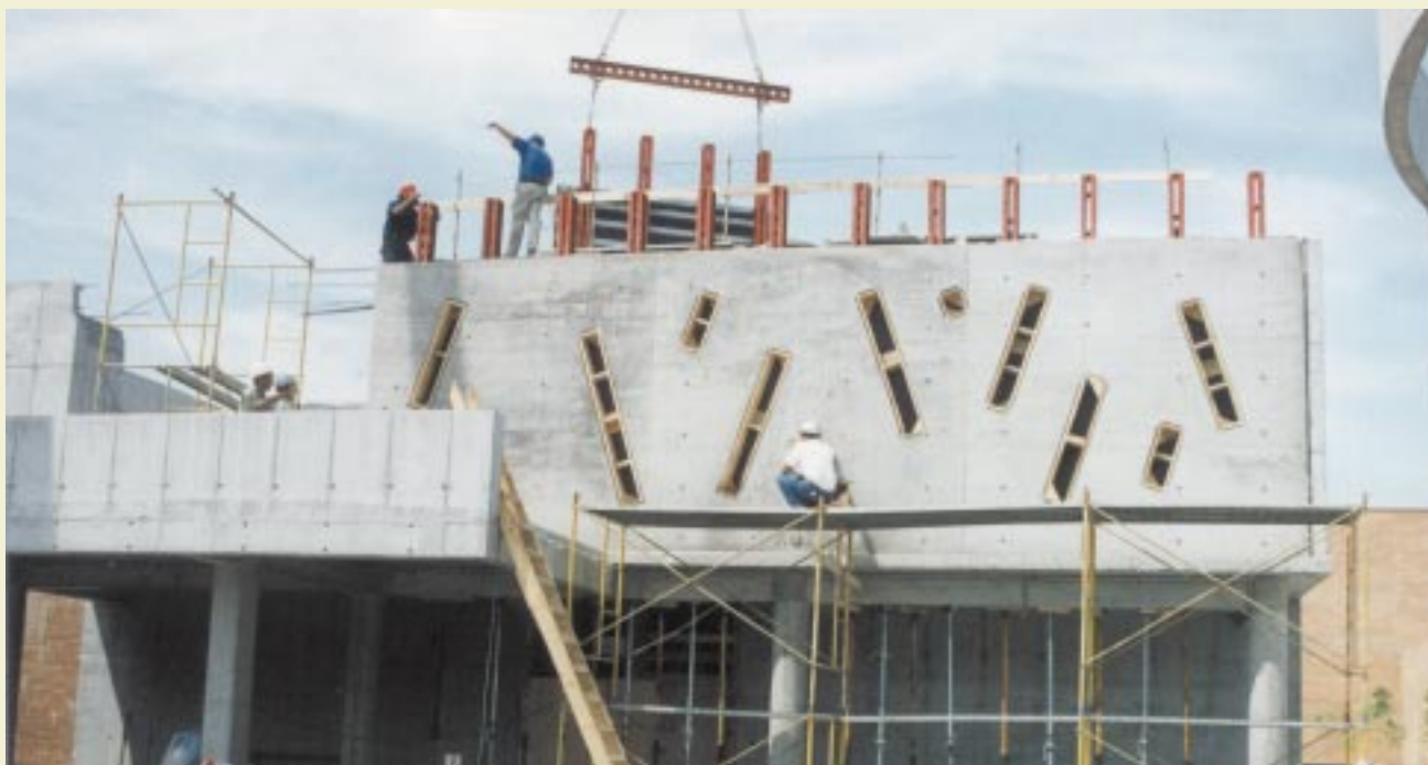
Vista de muro hormigonado con hormigón autocompactante bombeado desde la parte inferior, con una sola boca de entrada en el centro.