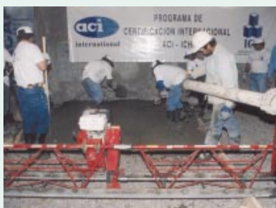
Curso práctico: confección en obra de losas planas para pisos y pavimentos de Hormigón