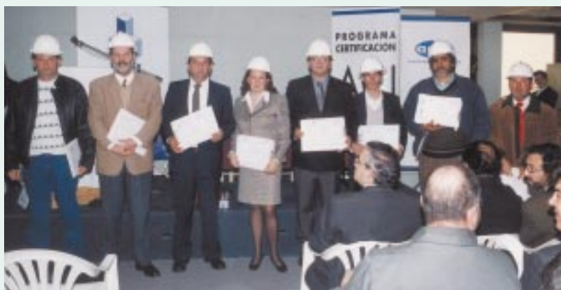
Curso: Construcción de obras de Hormigón

Los cursos también sirven de base para poder optar a los Programas de Certificación de Competencias Laborales ACI - ICH.